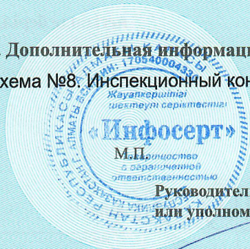
схема №8: Инспекционный контроль не предусмотрен.

Руководитель органа по подтверждению соответствия или уполномоченное им лицо